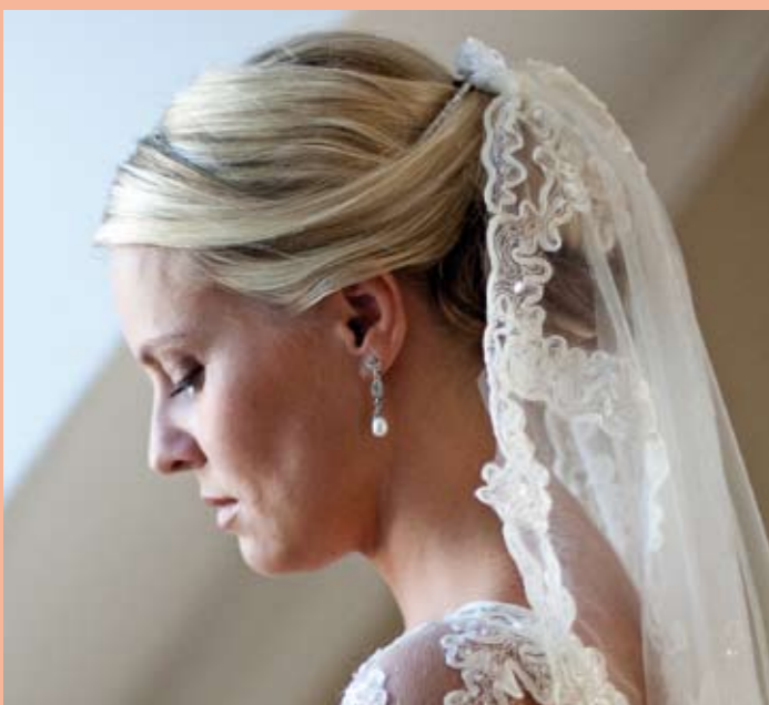
Hier sorgt ein romantischer Schleier für einen verträumten Look.