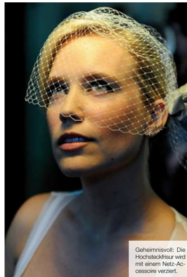
Geheimnisvoll: Die Hochsteckfrisur wird mit einem Netz-Accessoire verziert.