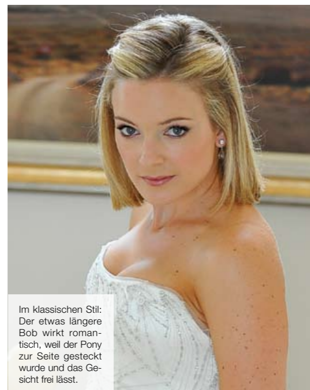
Im klassischen Stil: Der etwas längere Bob wirkt romantisch, weil der Pony zur Seite gesteckt wurde und das Gesicht frei lässt.