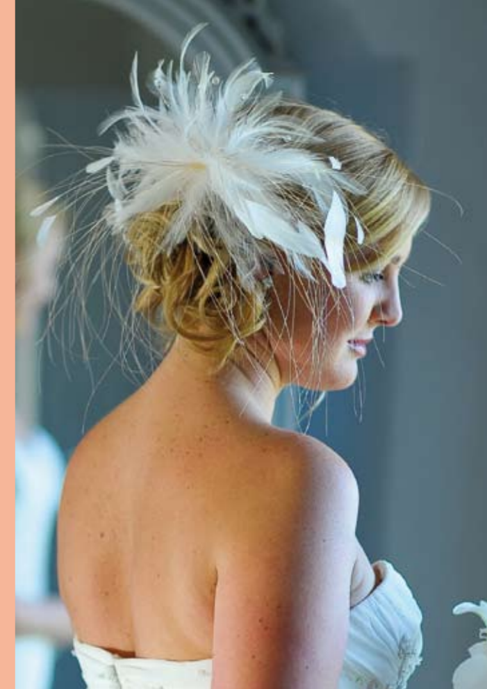
Opulenter Haarschmuck steht bei dieser Frisur mit seitlichem Chignon im Mittelpunkt.