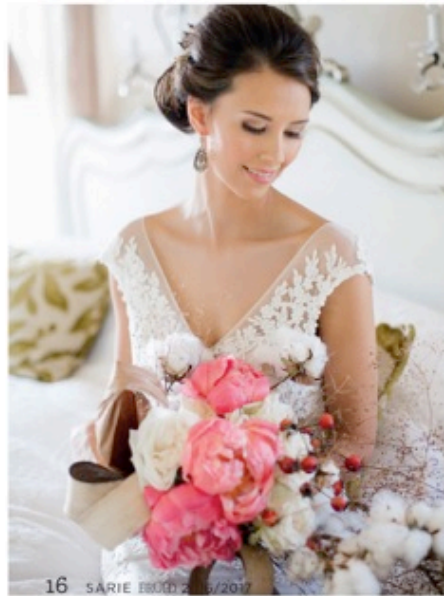
16 SARIE BROOD 1/2017

Brink en Silke wen 'n wegbreek as tweede wittebrood by Tintswalo Atlantic aan die Atlantiese kus naby Houtbaai in die Kaap, asook juweliersware, reistasse en parfuum