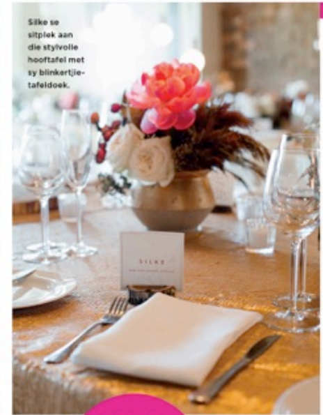
Silke se sitplek aan die stylvolle hoofafel met sy blinkertjie-tafelendoek.

Brink en Silke wen 'n wegbreek as tweede wittebrood by Tintswalo Atlantic aan die Atlantiese kus naby Houtbaai in die Kaap, asook juweliersware, reistasse en parfuum