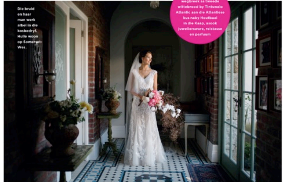
Die bruid en haar man werk albei in die kosbedryf. Hulle woon op Somerset-Wes.